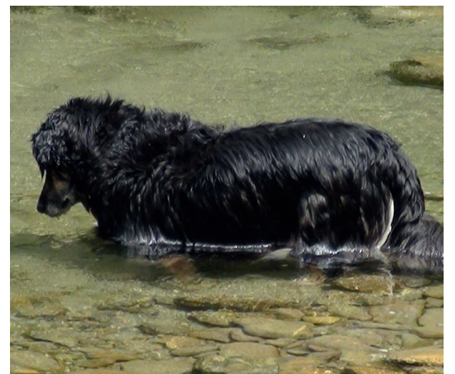
Baden erlaubt – aber bitte im Fluss und nicht im Tümpel.