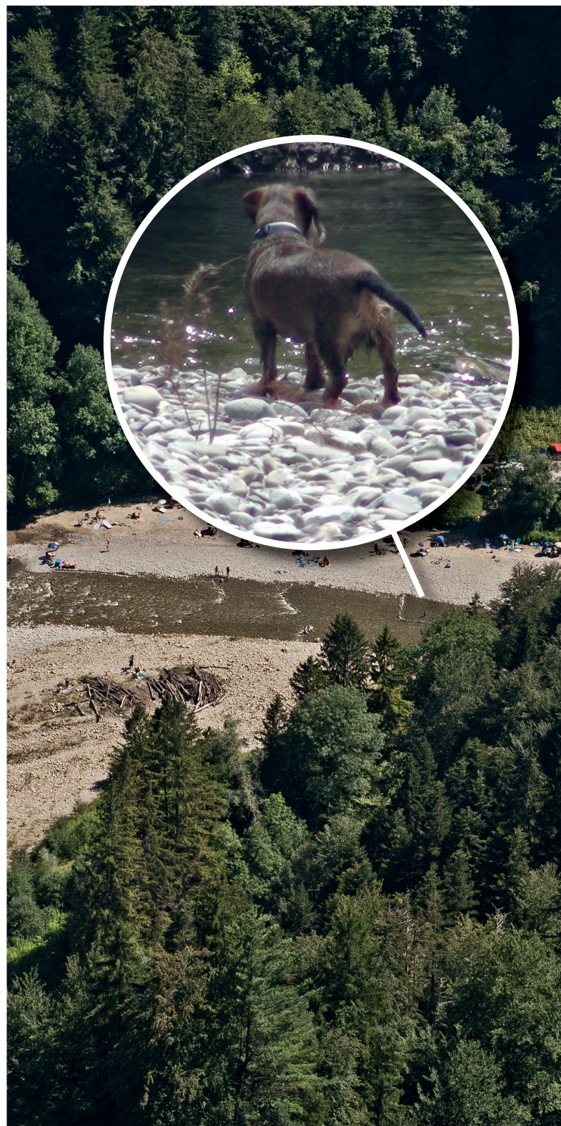
Sensegraben. Foto: www.reportair.ch , Lupe: Franziska von Lerber

Die Artikel können unter www.gantrisch.ch/natur heruntergeladen werden.