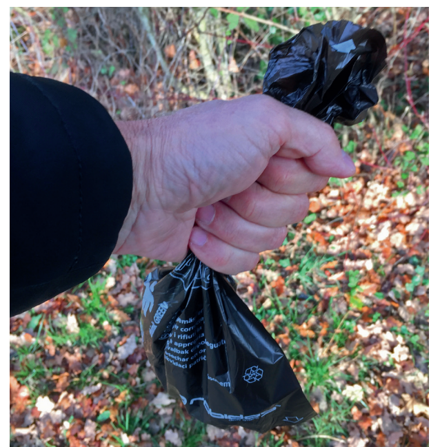
Mit einem Robidog-Beutel lässt sich der Hundekot bequem und hygienisch entsorgen.