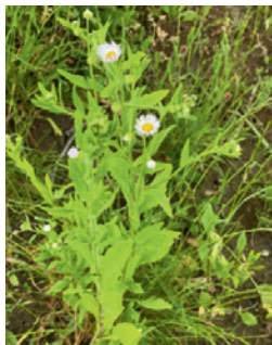
einjähriges Berufkraut in der Blüte